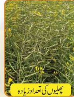
پھلیوں کی تعداد زیادہ